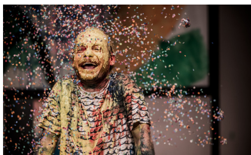
Bonte Nacht.